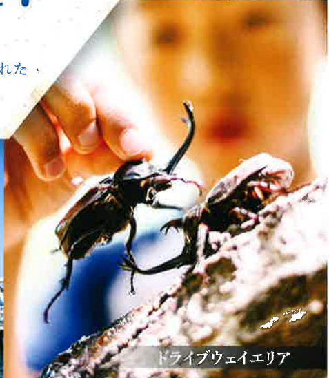
ドライブウェイエリア