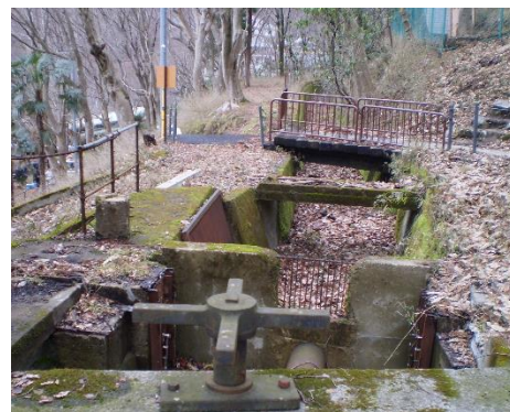
高野水力発電所跡